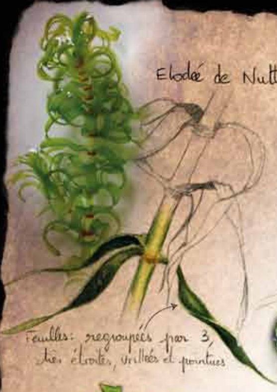
Elodé de Nuttall

Feuilles: regroupées par 3, les étroites, veinées et pointues