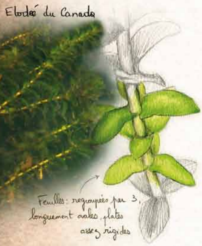
Elodé du Canada

Fleurs blanches à roses à 4 pétales, de 1 à 2 mm