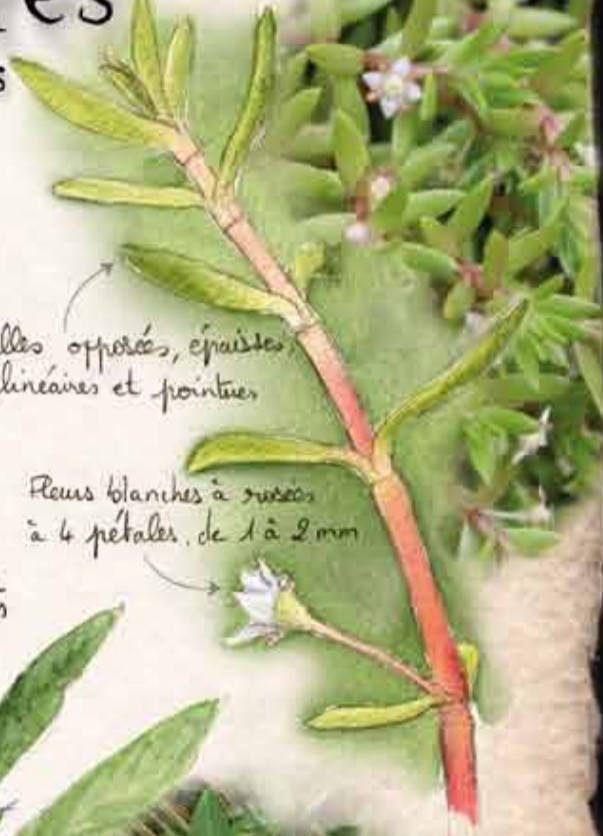
Crossule de Helms

Feuilles opposées, épaisses, linéaires et pointues